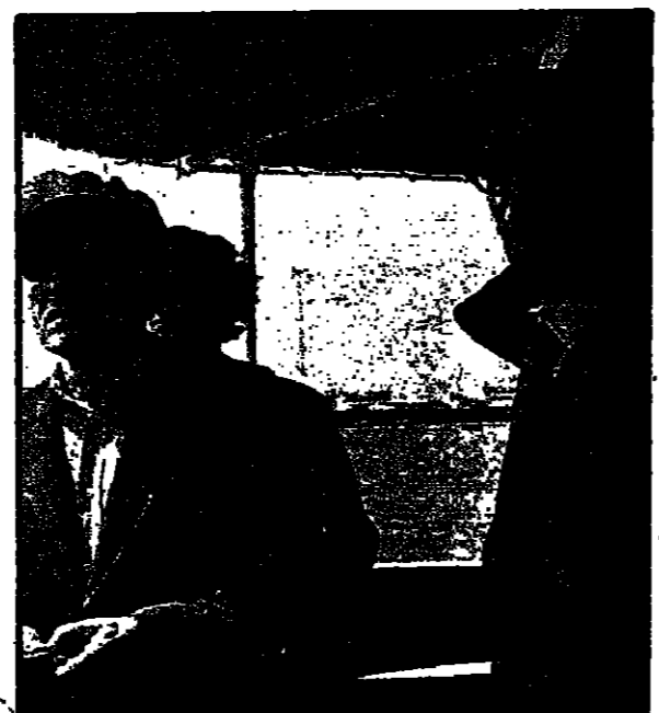
جون لتأسيس على ظهر لورق في بورسعيد يتطلع إلى وصول اسطوله في مدخل قناة السويس